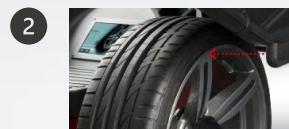
2 Smart Sonar : mesure automatique de la largeur de jante