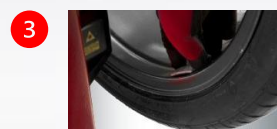
3 Easy weight : pointeur laser pour le positionnement des masses cachées avec répartition derrière les bâtons