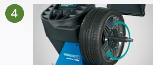
4 Serrage électrique avec arrêt en position Version « P »